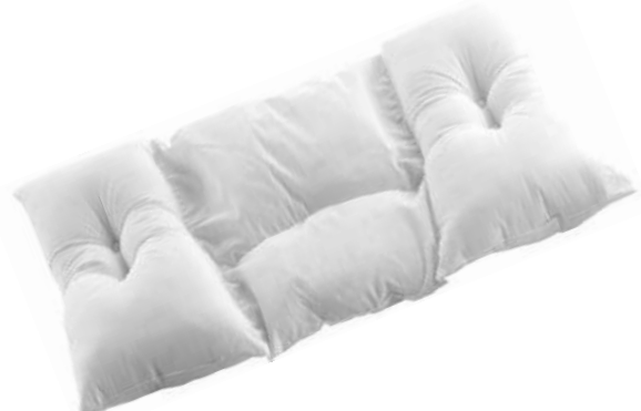
ショルダーフィットピロー プラス(中袋)

「ショルダーフィットピロー」は、頸椎と肩へのフィット感を重視した形状が特長の枕シリーズです。これまでは、5種類の異なる詰め物と2種類の高さ(ハイタイプ、ロータイプ)で展開していましたが、一般生活者からの「より自身にあった枕を使いたい」というご要望に合わせて、詰め物を硬さに特徴のある3種類の素材に厳選し、付属の高さ調整シートを出し入れすることによりハイタイプ、ロータイプの切り替えをご自身で行えるようになりました。また、詰め物の取り出しも可能なため、普段お使いの敷寝具の寝心地やお好みに合わせて、枕の高さや寝心地の微調整できる仕様にリニューアルしました。