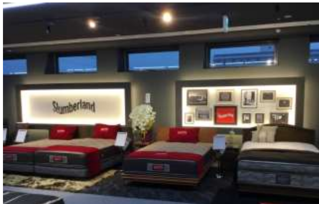
「フランスベッド PR スタジオ豊田 ベッド&ソファ」