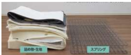
生地と詰め物、スプリングに分別。 素材にあった処分が可能。