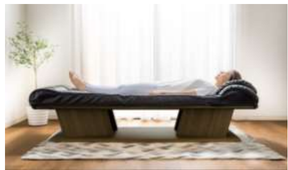
特定管理医療機器認定の ベッド型マッサージ器「ラミダス」