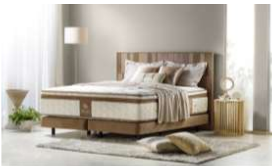
サステナブル仕様にリニューアル 「THE FRANCEBED」