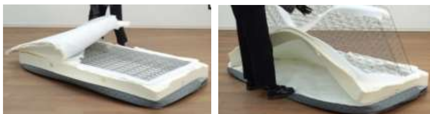
生地、詰め物、スプリングが干渉していないので簡単に分解できる(工具不要)